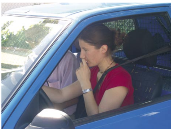
Formation des conseillers aux véhicules propres.

L'organisation en réseaux régionaux permet à la fois de garantir la mise en œuvre d'un service homogène et de qualité ainsi que la prise en compte des spécificités locales et des attentes des différents partenaires.