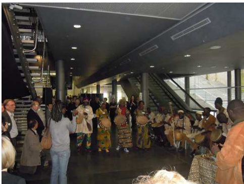
La représentation des danseurs maliens