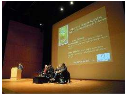
L'ouverture de la séance AlimentTerre