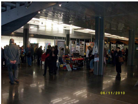
Le forum des stands