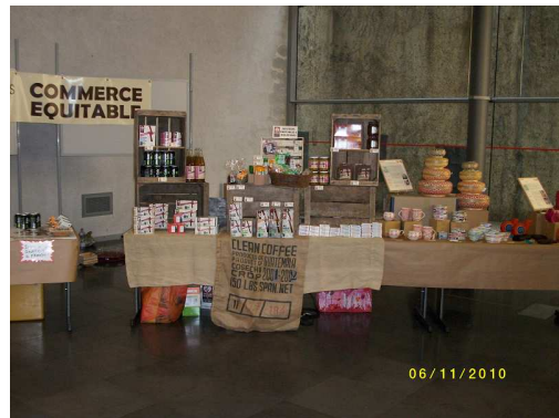
La dégustation de produits issus du commerce équitable