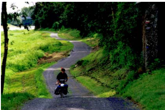
Pratique itinérante : une faible part de la fréquentation, un fort impact économique.